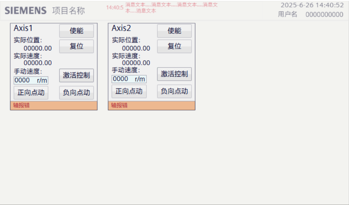
图 3.1.1 控制画面概况