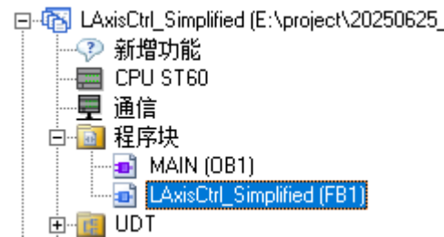
图 2.1.1 指令 FB